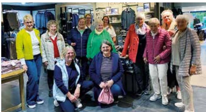
Strahlende Gesichter auf der ersten „Heimat shoppen“-Führung.

Aktuelle Informationen zu diesem und weiteren Freizeitangeboten in Bad Laer finden sich übrigens immer aktuell auf www.bad-laer.de/veranstaltungen .