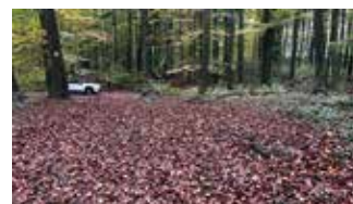
Hier fehlt sie ...