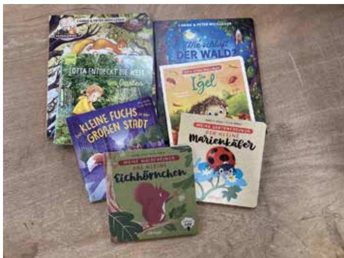
Auswahl aus dem Medienpaket „Erstes Weltwissen“

Kontakt: Angelika Brauns brauns@bz-niedersachsen.de