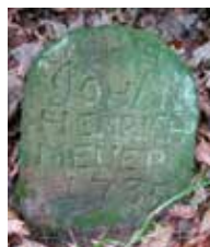
Grenzstein von 1735

Ganz geheuer war es uns Kindern daher nie auf der Brücke.