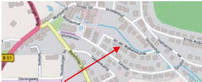
An der Walkenmühle