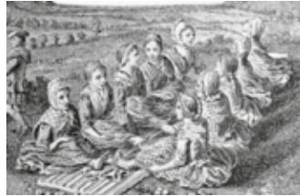
1770 war Fußwalken Arbeit der Frauen

Heute erinnert nur ein kleiner Teich an den Walkmühlenstandort. Eine Walkmühle (Walk-, Dick- oder Filzmühlen) ersetzte das Walken mit den Füßen von ca. 40 Walkarbeiter*innen. Das Walken verfilzte die Oberfläche frisch gewebter, warmer und feuchter Tücher durch Stoßen, Strecken oder Pressen, so dass sie dichter und geschmeidiger wurden. Loden ist z.B. ein gewalkter Stoff.