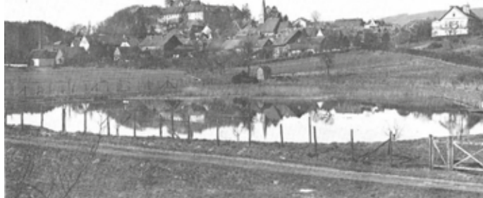
Ehemaliger Teich der Walkenmühle (K)

1661 erweiterte der Abt Jacobus Thorwarth, nach erheblichen Widerständen, die Mühle mit einer Walkmühle für die Iburger Tuchmacher und zwar als Ersatz für eine bereits vorher vorhanden gewesene Walkmühle.