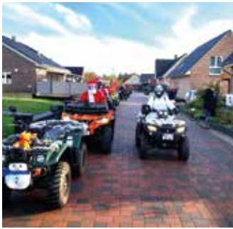
Diese überaus schöne Aktion wird schon seit vielen Jahren von allen Mitarbeiterinnen und