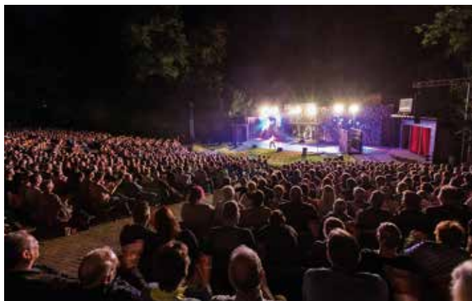
Auch im kommenden Sommer will die Waldbühne Kloster Oesede mit den beiden Musical-Stücken „Kein Pardon“ und „Spongebob Schwammkopf“ wieder für volle Ränge sowie beste Unterhaltung sorgen. Der Kartenvorverkauf beginnt am 1. Dezember.

Alle Informationen unter www.waldbuehne.com . Dort können die Tickets auch direkt online erworben werden. Weitere Vorverkaufsstellen sind: Buchhandlung Sedlmair (Oeseder Straße 94) und die Tourist-Information in Osnabrück (Bierstraße 22). Weitere Informationen erteilt auch das städtische Kulturbüro unter 05401/ 850 – 250.