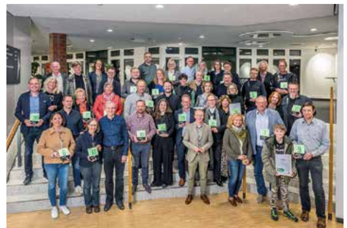
Bürgerinnen und Bürger im Landkreis Osnabrück, die energieeffiziente Sanierungs- und Neubauprojekte gestartet haben, wurden mit der Grünen Hausnummer ausgezeichnet.