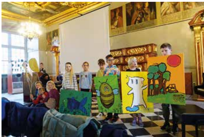
Die Kinderjury der Klassen 1 und 2 präsentieren ihre in der Projektwoche erstellten Arbeiten zu „Maria hilft den Tieren“.